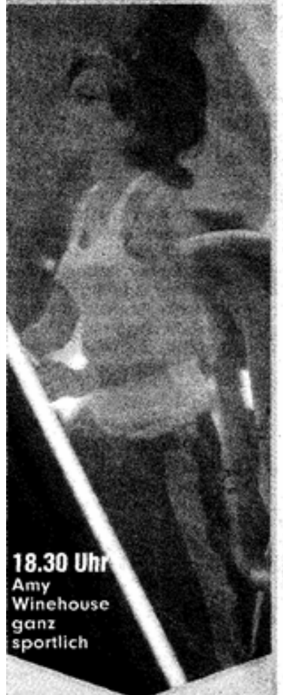
18.30 Uhr Amy Winehouse ganz sportlich

Hier sehen wir, wie Amy Winehouse (24) sich auf ihr Konzert heute im Tempodrom (Kreuzberg) vorbereitet. Im Fitnessstudio „LOKAHI LOFT“ in der Joachim-Friedrich-Straße (Wilmerdorf) schwitzte gestern die britische Soulsängerin erst mal an den Geräten. Und weil man sich's ja dann leisten kann, ging's danach zur Stärkung zu McDonald's. Eigentlich ist Amy ja Hobbyköchin, aber je nun, manchmal muss es Fast Food sein.